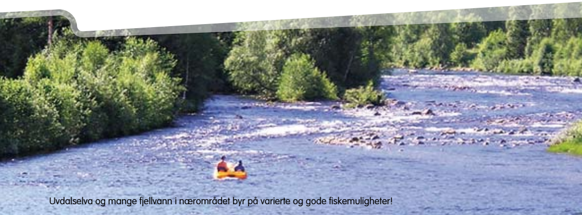
Uvdalselva og mange fjellvann i nærområdet byr på varierte og gode fiskemuligheter!

Vi anbefaler å legge turen til E.K.T. Langedrag Naturpark. I naturskjønne omgivelser ligger Langedragshusene som et Soria Moria slott 1000 m.o.h. med utsikt over vann og fjell mellom Hallingdal og Numedal. På fjellgården er det ca 26 forskjellige arter dyr og fugler. En opplevelse som setter spor.